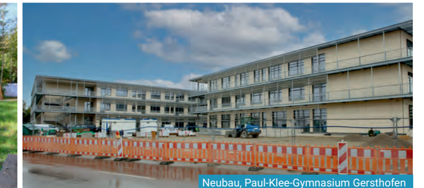
Neubau, Paul-Klee-Gymnasium Gersthofen