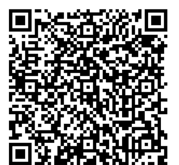
Genauere Informationen unter: www.landkreis-augsburg.de/kulturlandschaft