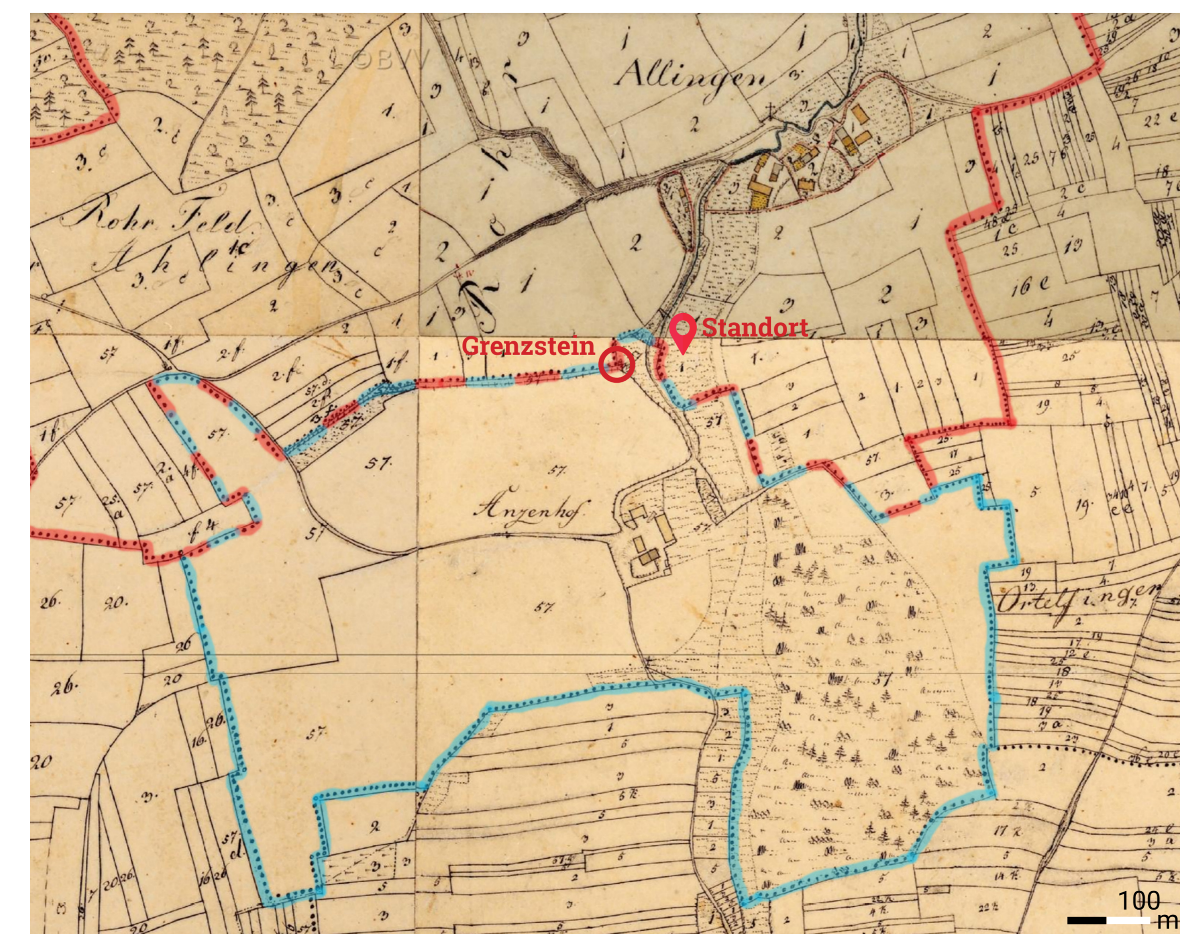
Historischer Grenzverlauf zwischen Ahlingen und Anzenhof dargestellt in der Karte von 1850 (blau-rot gestreifte Linie)