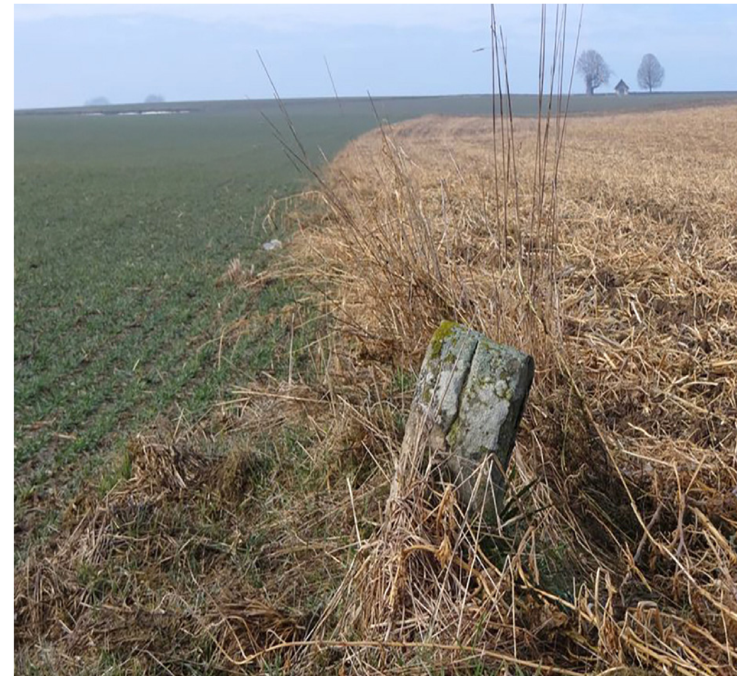
Grenzstein von der Seite mit Kapelle im Hintergrund

Forst-, Holzmark- und Jagdsteine regeln spezielle Nutzungsrechte, ebenso Fisch-, Wasser-, Brunnen- und Quellsteine. Trieb-, Weide- und Wegesteine zeigen Nutzungs- und Zugangsrechte an, die auch in andere Gebiete hineinreichten. Bergwerksrechte wurden durch sogenannte Loch- oder Schnursteine markiert.