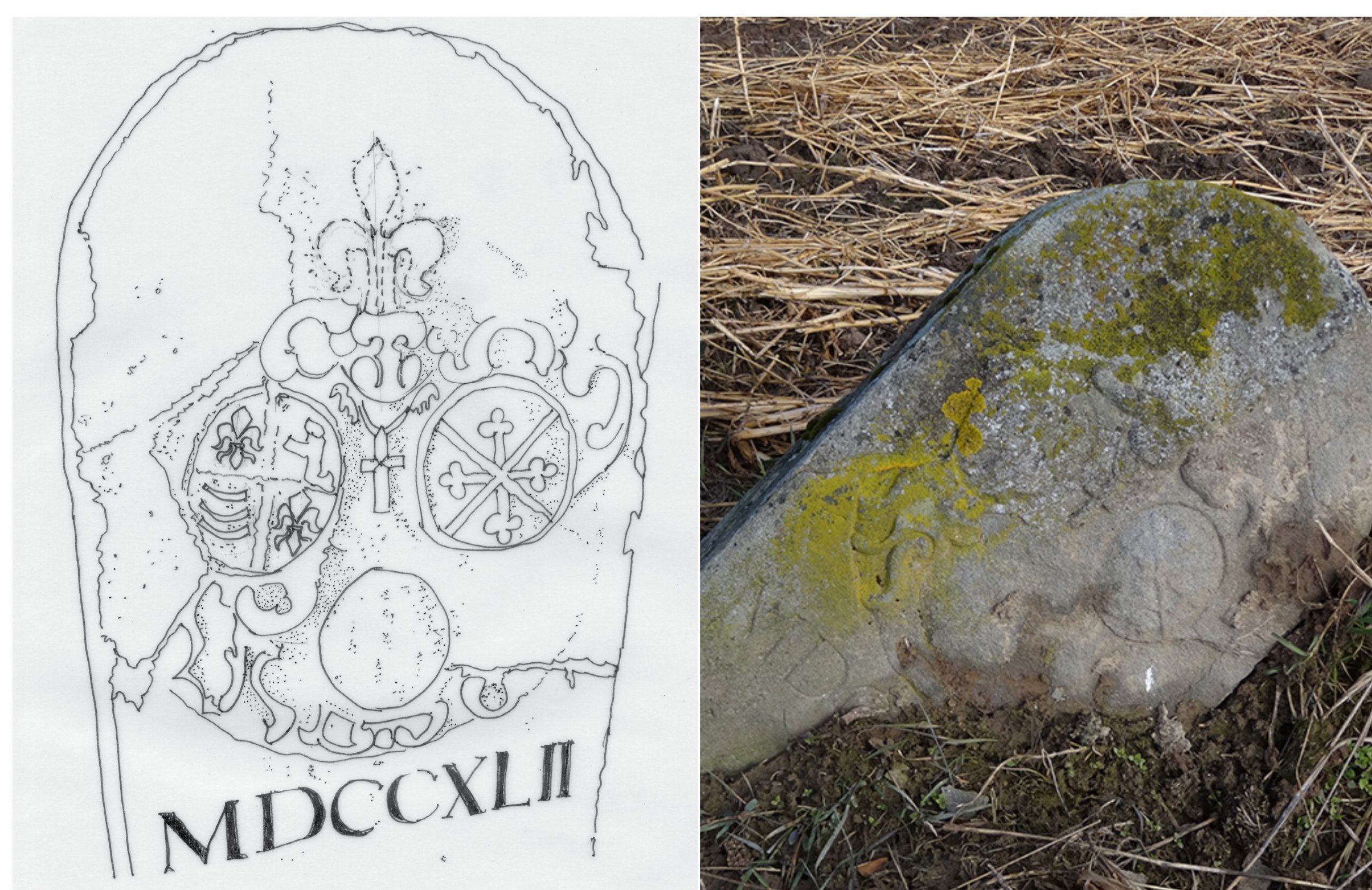
Zeichnung und Original des Wappensteins, Wappen der Fuggerschen Herrschaft (links) und Wappen des Reichstifts St. Ulrich und Afra (rechts)