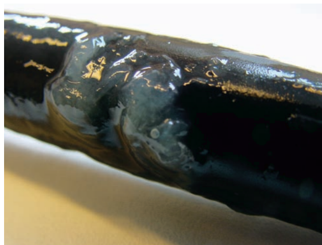
Abb. 2: Organischer Werkstoff mit starker Biofilmbildung