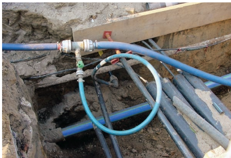
Abb. 4: Notwasserversorgung mit Schläuchen

Während Stagnationsphasen (z. B. über Nacht) ist die Gefahr einer Verkeimung des Trinkwassers auf Grund des geringen Durchmessers der Schläuche und der zum Teil hohen Temperaturschwankungen gegeben. Deshalb sollte die Verweilzeit des Trinkwassers in den Schläuchen möglichst kurz gehalten werden; die Schläuche und Leitungen sollten an die tatsächlich