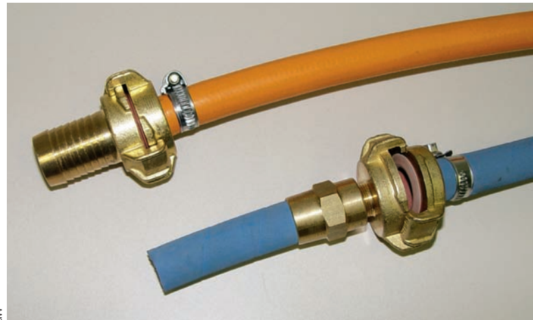
Abb. 3: Beispiele für Schläuche und Schlauchverbindungen (VP 549 und VP 550)

Für die metallenen Schlauchverbindungen und Schlaucharmaturen sind die Anforderungen an den Werkstoff in der DIN 50930-6 geregelt.