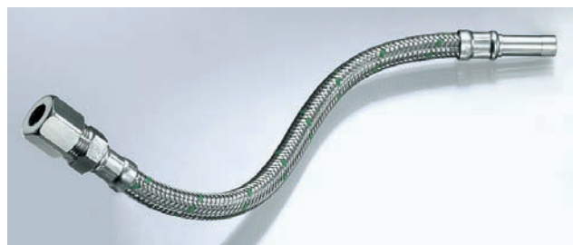
Abb. 1: Beispiel für eine druckfeste flexible Schlauchleitung für die Trinkwasser-Installation (W 543)