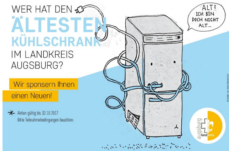
Bild 2: Die Aktion „Wer hat den ältesten Kühlschrank im Landkreis Augsburg“ läuft bis 30. Oktober 2017.