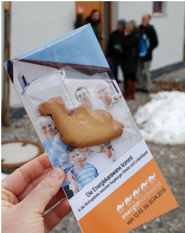
Bild 1: Bereits zum vierten Mal macht die Energiekarawane Station in Schwabmünchen.