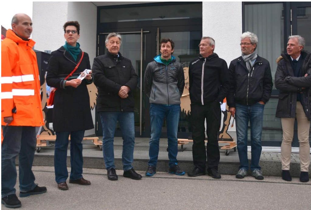
Bild 2: Die Energieberater sind dieses Mal im Wohngebiet zwischen der Augsburgur Straße und dem Luitpoldpark