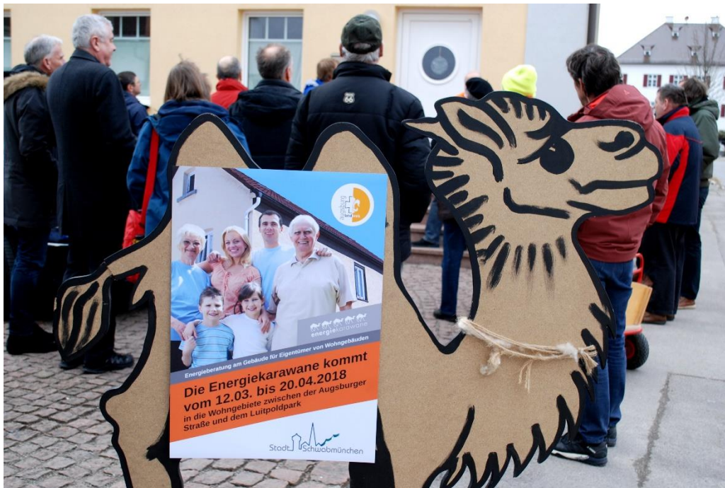
Bild 5: Beim Auftaktspaziergang am 9. März 2018 zu bereits sanierten Gebäuden konnten sich Interessierte über Chancen und Möglichkeiten der energetischen Modernisierung informieren.