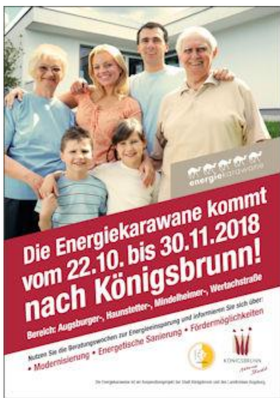
Bild 1: Sechs Wochen ist die 2. Energiekarawane in Königsbrunn unterwegs.

cken, Erneuerung der Heizung oder Fenstertausch. Bei 13.000 Euro lag die durchschnittliche Investitionssumme, meist führten lokale Handwerker die Arbeiten durch. Energieeinsparung, Klimaschutz und regionale Wertschöpfung, so lauten die gebündelten Erfolgsfaktoren der Karawane. Bestnoten erhielten übrigens auch die Energieberater, die meisten von ihnen sind bei der 2. Energiekarawane in Königsbrunn wieder mit von der Partie. ■