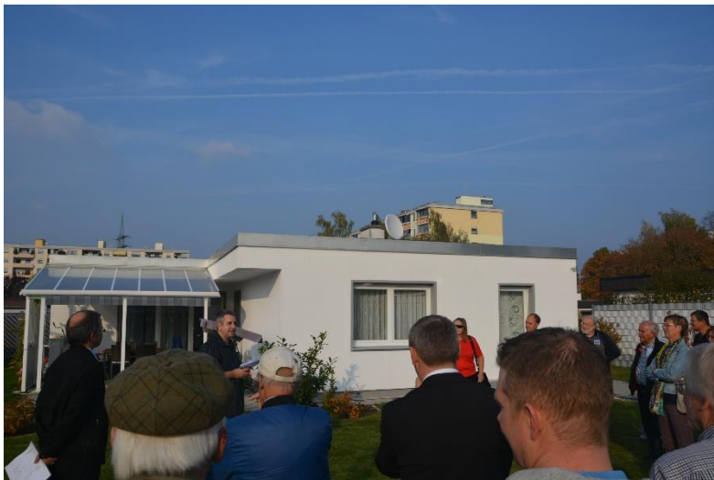
Bild 3: Vier Hausbesitzer, die bereits Sanierungsmaßnahmen durchgeführt hatten, informierten beim Auftaktspaziergang rund 40 Interessierte über Chancen und Möglichkeiten der energetischen Modernisierung sowie über ihre dabei gemachten Erfahrungen.

Fotos/Grafik: Margit Spöttle, Landratsamt Augsburg. Abdruck bei Quellenangabe honorarfrei.