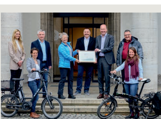
Auszeichnung ADFC

Außerdem: Der Landkreis hat erfahren, dass er sich erfolgreich als Gastgeberregion bei den Special Olympics World Games 2023 beworben hat: Von 12. bis 15. Juni 2023 wird eine Delegation aus Mali zu Gast im Landkreis Augsburg sein.