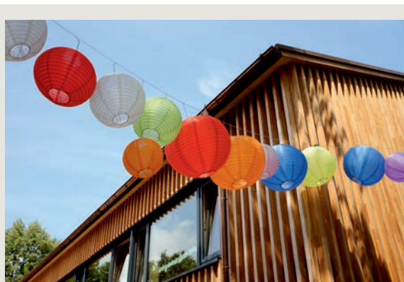
Bildquelle: Jens Reitlinger, Feierlichkeiten Rücklenmühle

Außerdem: Am 23. Juli wird das neue Jugendfreizeitgelände Rücklenmühle nach umfangreicher Sanierung und Erweiterung bei einer großen Feier eingeweiht und mit einem Tag der offenen Tür vorgestellt.