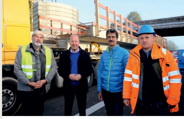
Einbau Beton-Fertigteilträger

Außerdem: Mit dem Solar- und Gründachpotenzialkataster können Bürgerinnen und Bürger des Landkreises ab sofort die Energiepotenziale des Eigenheims selbst überprüfen und nachsehen, ob ihre Dächer für eine Photovoltaik- oder Solarthermieanlage oder eine Begrünung geeignet sind.